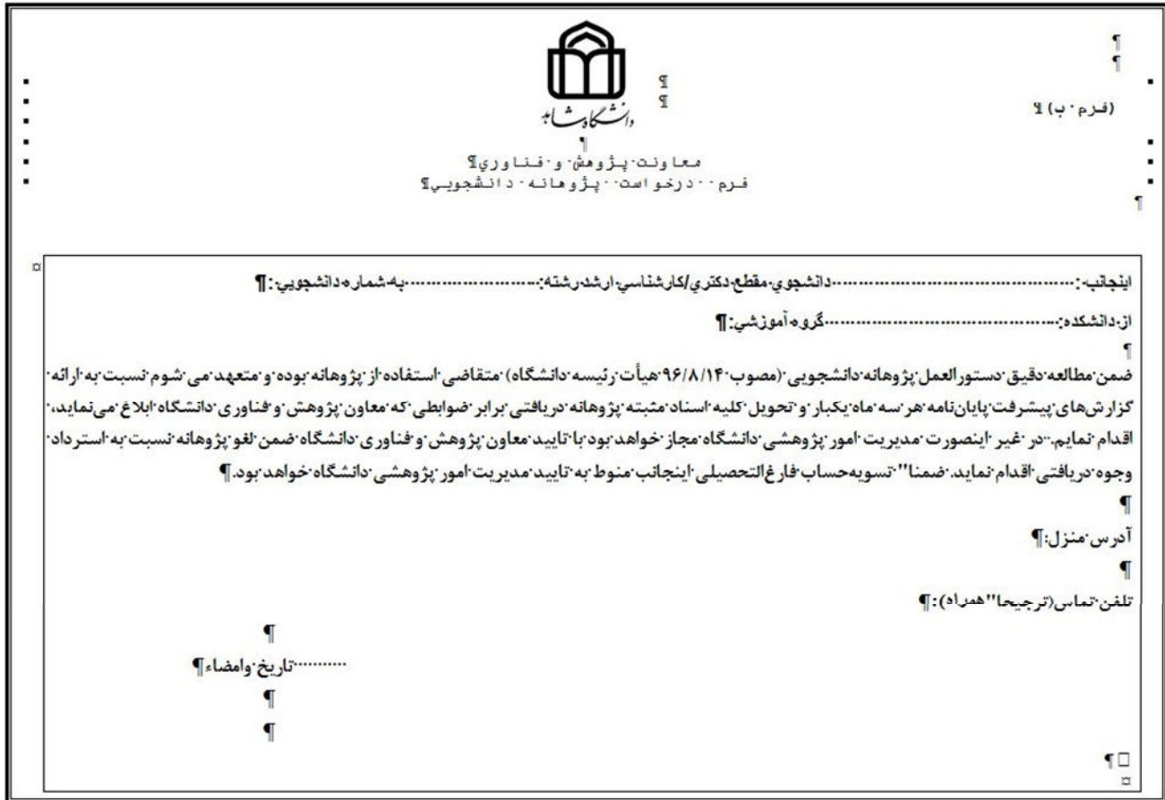
(نمونه فرم تعهد نامه)

در صورتی که متقاضی پژوهانه هستید ضمن مطالعه دقیق دستورالعمل تخصیص پژوهانه به دانشجویان ، فرم تعهد نامه را دانلود کرده و پس از تکمیل، آن را اسکن و با فرمت jpg و حتما با عنوان غیرفارسی ذخیره و در قسمت فرم تعهد نامه سامانه بارگذاری نمایید و در آخر دکمه ثبت درخواست پژوهانه را کلیک نمایید. (دقت کنید پس از ثبت درخواست اجازه ویرایش ندارید)